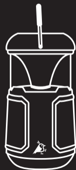
Modèle : Soundbird B10